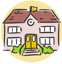
École 200 $