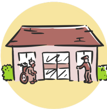
Maison de repos 200 $