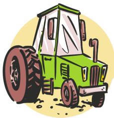
Tracteur 200 $