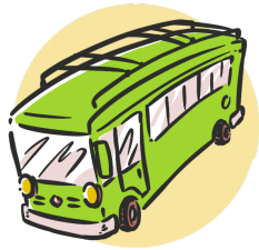
Service de bus 200 $