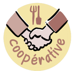
Inscription à la coopérative 10 $