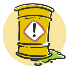
Produits chimiques 10 $ la dose/champ