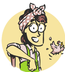
Main-d'œuvre • Amérique latine 30$ • Afrique 20$ • Europe 50$