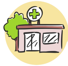
Infirmierie 200 $