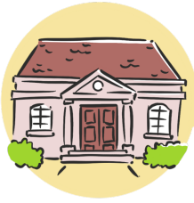
Élections 200 $