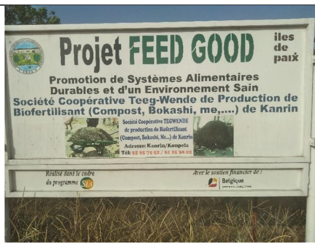
Site de la Scoop Teeg-Wende