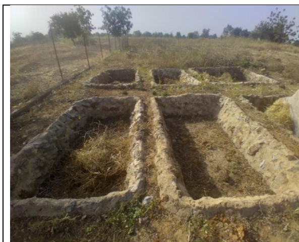
Fosses de compostage à Kanrin