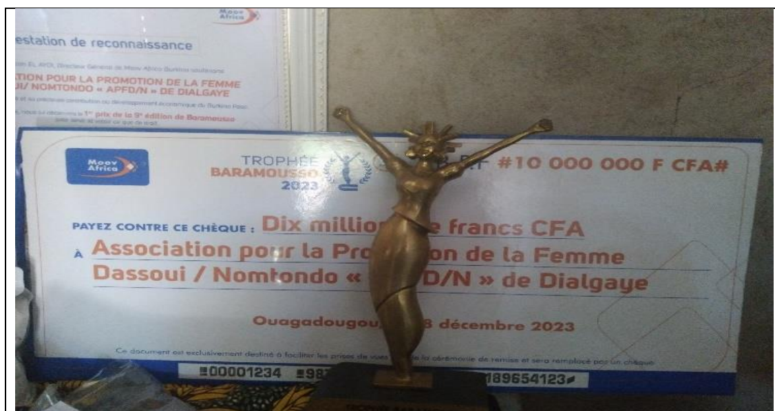
Trophée de l'APFD/N

Les ONG SIA avec leurs partenaires accompagnent les bénéficiaires à mettre en place des modèles économiques en fonction du statut de leurs entreprises qui puissent leur permettre d'assurer la continuité, de s'autofinancer et de couvrir leurs charges. Le renforcement de capacité permet aux coopératives d'être plus performantes. Elles développent elles-mêmes des mécanismes de "tontine" et sont capables de monter des dossiers pour bénéficier de subventions. C'est l'exemple de la subvention d'une valeur de 10 millions obtenue par les femmes de Dassoui (APFD) pour la réalisation d'un forage. La mise en relation des associations avec les institutions de microfinances les permet d'accéder à des ressources adaptées à leurs besoins. Le modèle de complémentarité permet aux associations de diversifier leur source d'appui et de réduire la dépendance à un seul partenaire. Ce qui constitue un gage de durabilité économique.