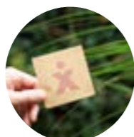
Nos volontaires de différentes régions